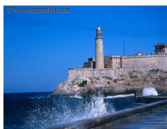
El Morro el MORE-oh