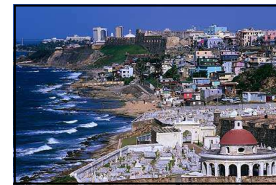
la capital San Juan la cah-pea-TAHL Sahn who-AHN