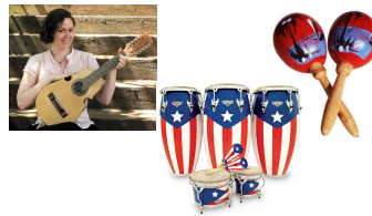
la música Salsa y Plena la MOO-see-cah SAHL-sah eee PLAY-nah