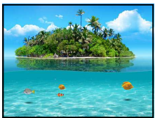
una isla ooh-nah EEE-slah