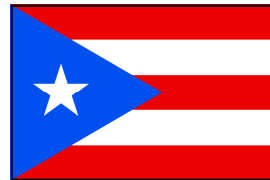
la bandera la bahn-DAIR-ah