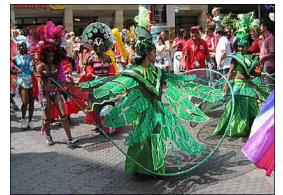
el carnaval el car-nah-VAHL